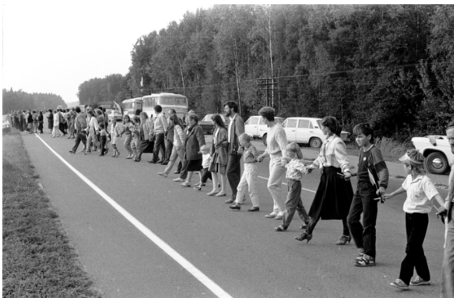
Svobodné Pobaltí: Baltský řetěz (srpen 1989)