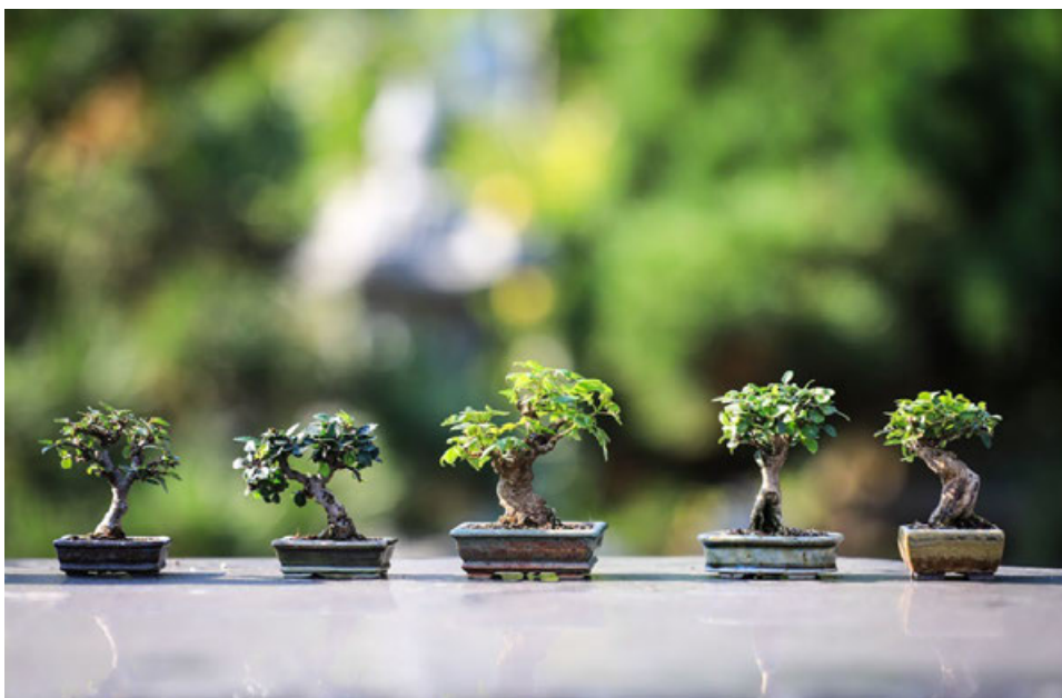
Víkendová výstava bonsají 16. — 17. května