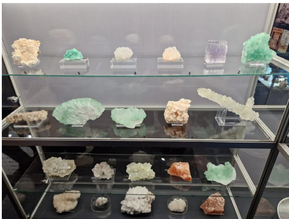
Království soli pod Slánskou horou muzeumslany.cz/.../expozice-soli

V rámci slavností bude v pátek 16. května v 18 hodin v atriu muzeu zahájena víkendová Výstava bonsají , která bude otevřena v sobotu 17. května od 10 do 18 hodin. V průběhu výstavy bude pro návštěvníky k dispozici základní poradenství pro pěstování bonsají, možnost přinést ke konzultaci vlastní rostliny, možnost zakoupení rostlin i bonsajových pomůcek, a také komentované prohlídky.