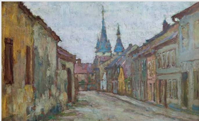
Ludvík Kuba, Ulička ve Slaném (dnešní Štechova), 1934