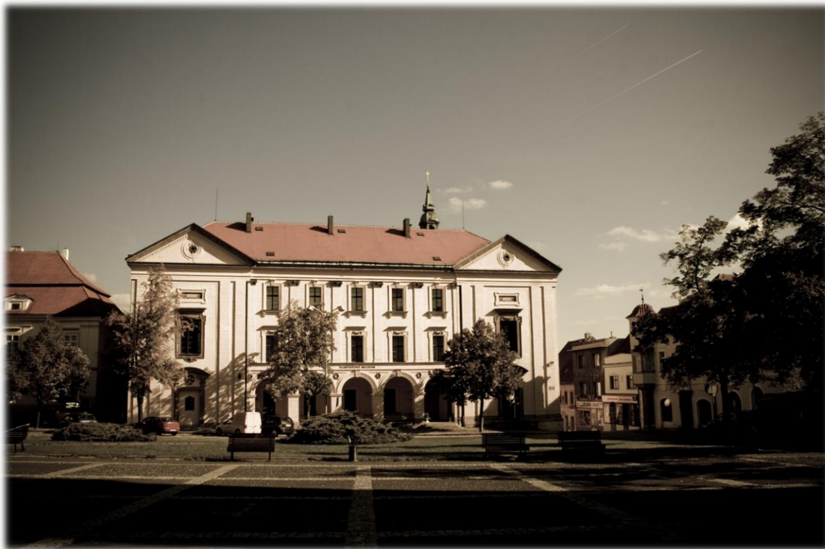
Bývalá piaristická kolej, foto Jan Studený

I. Začátkem září se v celé Evropské unii, tedy i ve Slaném, uskuteční Dny evropského dědictví . Jejich cílem je zpřístupnit co nejširší veřejnosti významné památky minulosti. Program ve Slaném je soustředěn na sobotu 6. září a jeho garantem je odbor kultury