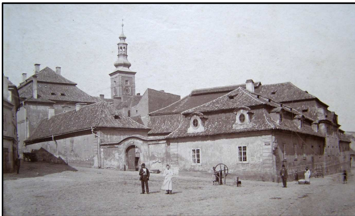
Zaniklý Clam – Martinický pivovar ve Slaném na dnešním Komenského náměstí.