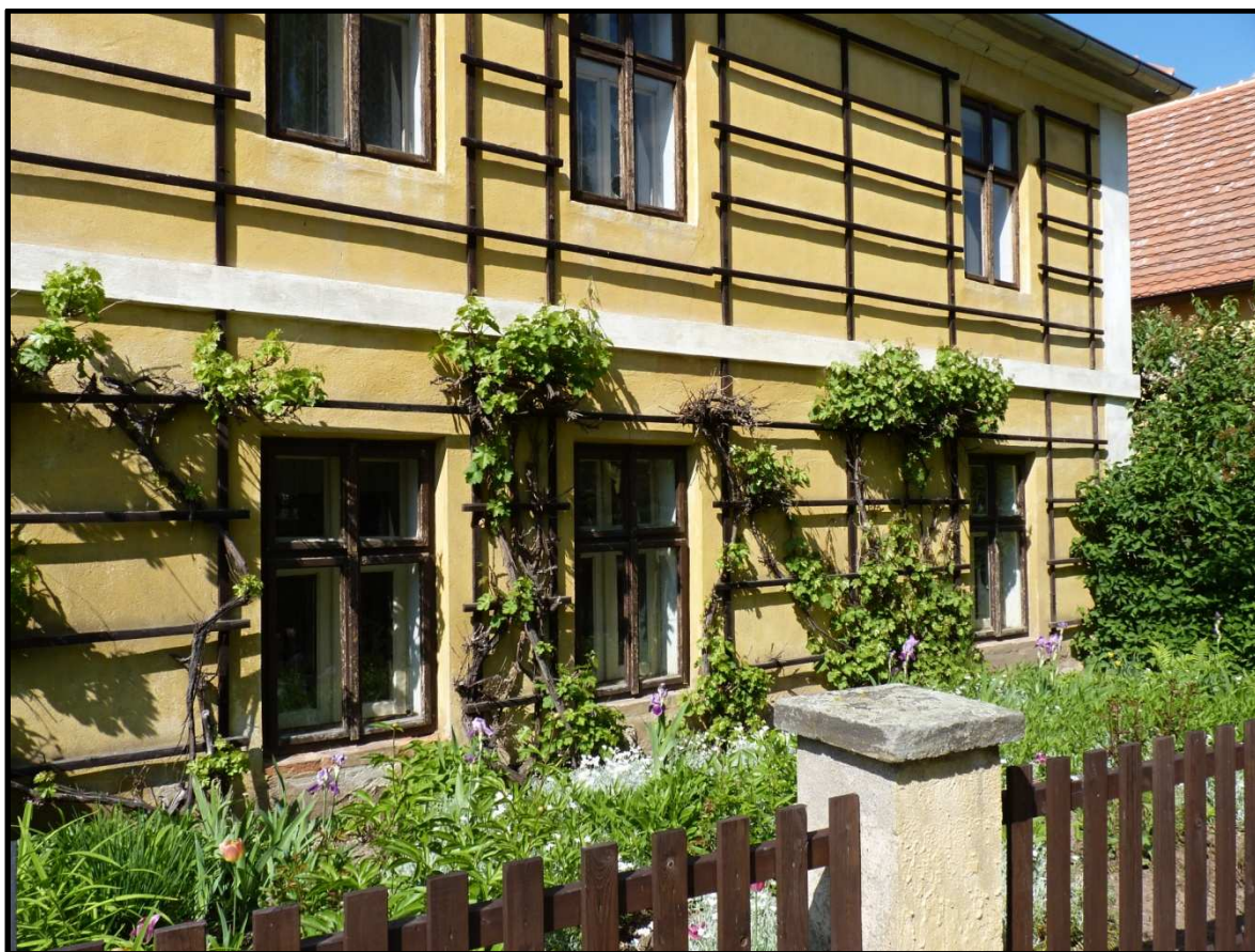
Návesní průčelí Šubrtova statku čp.2 ve Třebízi.

v letních měsících láká k návštěvě především malebný areál Národopisného muzea ve Třebízi. Jak sami návštěvníci říkají, takový klid a prostředí přímo vybízející k odpočinku v parných letních dnech, absence rušné dopravy či neodbytných prodavačů – „stánkařů“ se v širokém okolí jen tak nevidí.