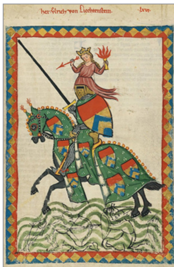
Codex Manesse, počátek 14. století

? Zamyslete se nad tím, jak mohli v dobách středověkých rytířů měřit čas.