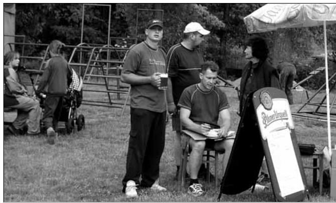
Organizace turnaje nebyla jednoduchá (P. B.)

Gratulacemi a předáním cen za pétanque však otrubská sobota nekončila. Teprve po napínavých bojích se hráči i povzbuzující diváci začali příjemně bavit. Nechybělo perfektní občerstvení ze slánské restaurace