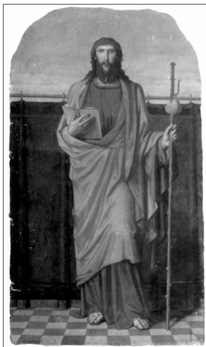
Obraz svatého Jakuba z lidického kostela od Josefa Sequense z roku 1880