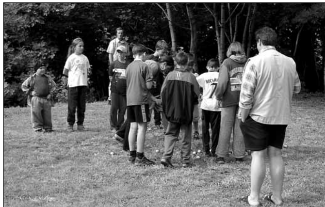
I v kategorii do 15 let se hrálo se 100% nasazením